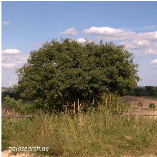
Grossgewachsene Pflanze ohne Rückschnitt