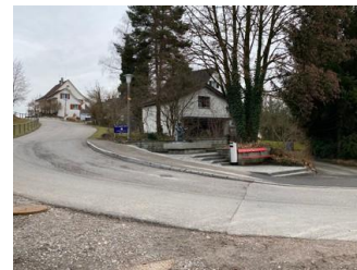
Ansicht von der Brunnenbühlstrasse; links Parzellen Kat. Nrn. 13509, 13493 und rechts Parzelle Kat. Nr. 12084

Die Parzellen Kat. Nrn. 12084, 13506 und 13493 umfassen total 4'630 m 2 und befinden sich im Alleineigentum der Gemeinde Rüti. Dabei befinden sich total 1'886 m 2 der Parzellen Kat. Nrn. 13509 und 12084 in der Wohnzone und die übrige Fläche von 2'744 m 2 der Parzelle Kat. Nr. 13493 in der Landwirtschaftszone.